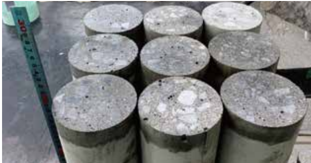
▲ ローラーストーン施工試験体