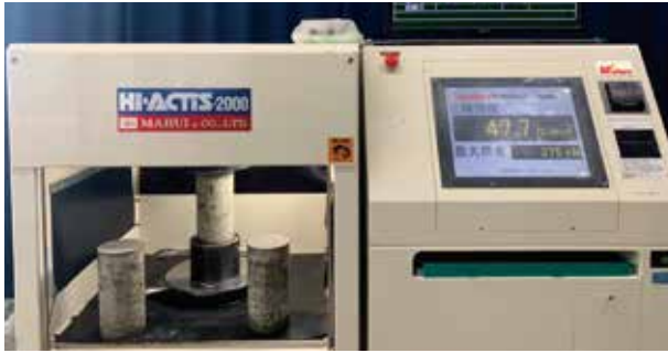
▲ 圧縮強度検証の様子