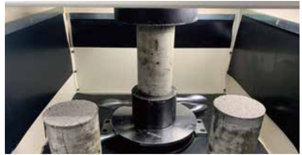
▲ 圧縮強度検証の様子(拡大)